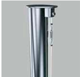
Mastkopf Z75 Edelstahl

K7 - K12 Edelstahl: Mastrohr konisch, für Nennhöhen 7 m bis 12 m