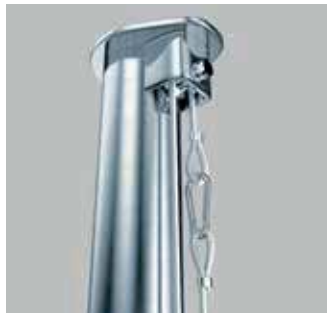
Mastkopf K7-K12 Edelstahl