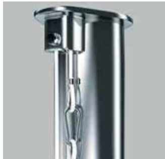
Mastkopf Z100 Edelstahl