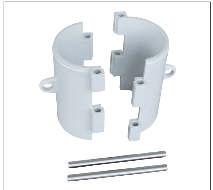
Halbschalen links/rechts, VA-Steckbolzen (450 g)