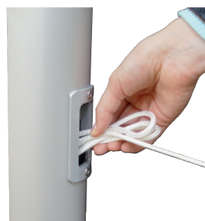
Nach dem Hissen Seil in Schlaufen legen und als Bund in das Bediengehäuse stecken.