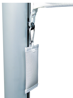
Fahngewicht am untersten Fahnentuchhalter einhaken.