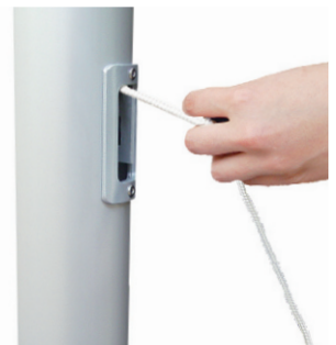
Hissen der Fahne durch horizontales Ziehen, nach dem Loslassen arretiert das Hisseil selbstständig.