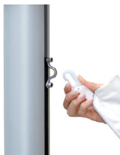
Obersten Fahnenkarabiner in Öse des Langschlittens einhaken.

Die Standsicherheit des Mastrohres gewährleisten wir für den Zeitraum von 5 Jahren, die Funktion der Hissvorrichtungen für den Zeitraum von 2 Jahren, jeweils ab Lieferdatum. Einzelheiten hierzu sind im Garantiezertifikat geregelt, das wir auf Anforderung gerne zusenden.