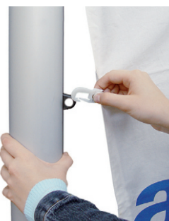
Übrige Fahnenkarabiner in Ösen der Fahnentuchhalter einhaken.