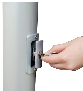
Bedientüre entsperren und Perlon-Hisseil entnehmen.

Achtung bei abgenommener Fahne stets Fahnen-gewicht in die Öse des Langschlittens einhängen um „Ablassen“ des „leeren“ Langschlittens zu gewährleisten.